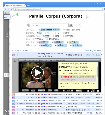
図 1. 対訳コーパス・コーポラの画面

見出し語検索を基本とし、go で goes, went などがヒット。文字大小の区別はしない。書式には正規表現を採用。任意単語や文字検索、綴り字検索、論理和検索、疑問文検索が可能。検索は字幕単位で行う句検索仕様とした。入力補完辞書は中学・高校・大学受験の 3 種。中学が慣用句 371 個、単語