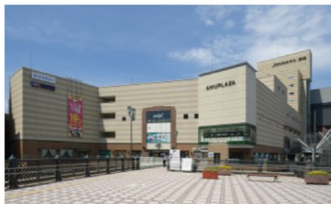
アミュプラザ長崎 本館