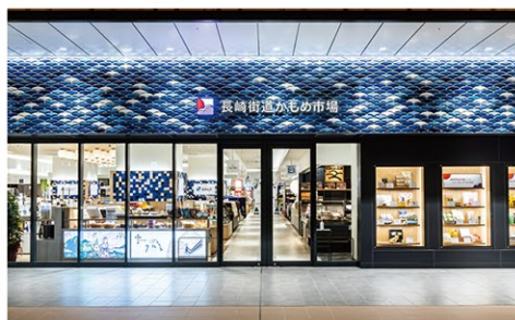
長崎街道かもめ市場

長崎の玄関口である駅ビルとして、 最新トレンドを発信する高感度ファッション・雑貨をはじめ、 味にこだわる話題のレストラン、日常の生活に上質と彩りを提案する食品、 その他シネマやエンタメ・サービス、コミュニティの拠点など、 幅広い年代のお客さまに心地よい時間と空間をご提供する大型商業施設です。