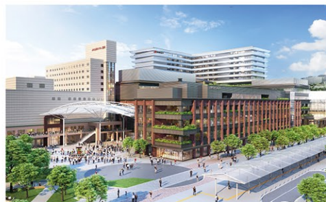
アミュプラザ長崎 新館

長崎の玄関口である駅ビルとして、 最新トレンドを発信する高感度ファッション・雑貨をはじめ、 味にこだわる話題のレストラン、日常の生活に上質と彩りを提案する食品、 その他シネマやエンタメ・サービス、コミュニティの拠点など、 幅広い年代のお客さまに心地よい時間と空間をご提供する大型商業施設です。